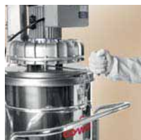
Sacudidor de filtro manual

Os aspiradores industriais Comac são produzidos de série com cubas de depósito pintadas (à excepção dos modelos CA1.25, CA1.30, CA2.30, CA1.50, CA2.50, CA30 S, CA30 SS, CA40 ON ATEX22). No entanto, a pedido e como opcional, todos os modelos poderão ser fornecidos com cubas de aço inox.