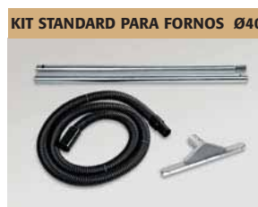
KIT STANDARD PARA FORNOS Ø40