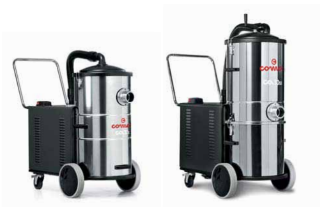
CA30 S/CA30 SS