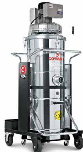
CA40 ON ATEX22