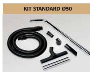
KIT STANDARD Ø50