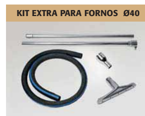
KIT EXTRA PARA FORNOS Ø40

Os aspiradores são fornecidos de série com redutor de Ø 70-50