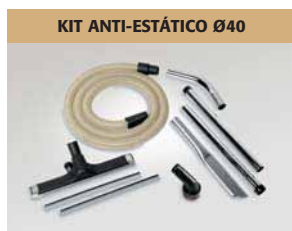
KIT ANTI-ESTÁTICO Ø40