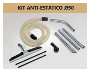
KIT ANTI-ESTÁTICO Ø50