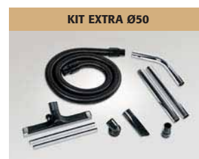
KIT EXTRA Ø50