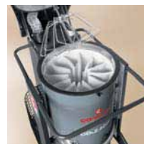
Filtro estrela de superfície ampla