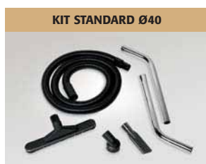
KIT STANDARD Ø40