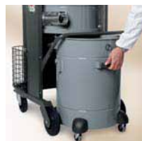
Depósito extraível sobre rodas