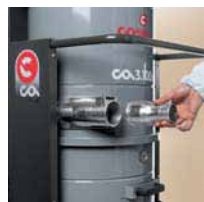
Boca de entrada tangencial