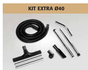
KIT EXTRA Ø40