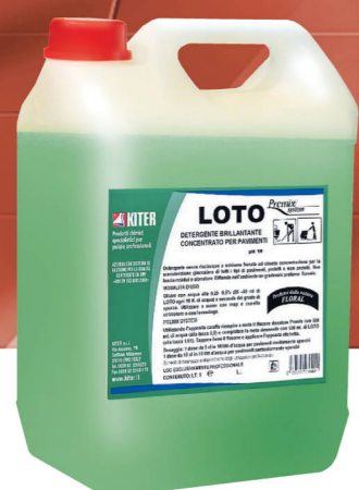
Embalagen de 5 lt. de produto LOTO para pavimentos.