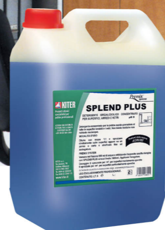
Embalagen de 5 lt. de produto SPLEND PLUS para superfícies e móveis.