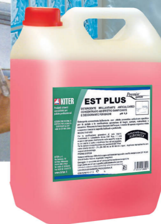
Embalagen de 5 lt. de produto EST PLUS para banheiros.