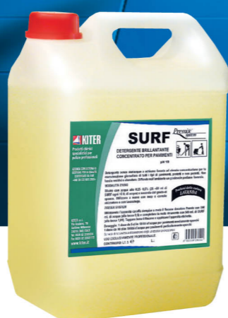
Embalagen de 5 lt. de produto SURF para pavimentos.